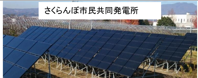
さくらんぼ市民共同発電所