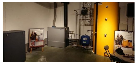
日本初マイクロ熱供給バイオマスボイラー展示場