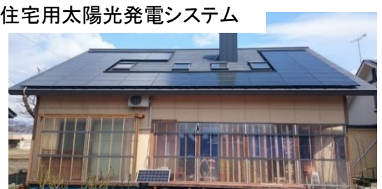
企業向け・一般住宅用太陽光発電システム