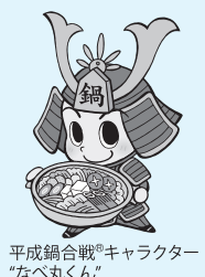
平成鍋合戦®キャラクター “なべ丸くん”

ことしも12月に県総合運動公園を会場に開催します。平成鍋合戦®を一緒に盛り上げてみませんか。