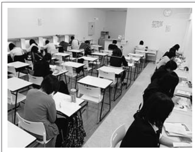
▲市学習支援室「リバテラスちえふる」

6月3日 7月7日 7月8日 7月21日 7月22日 8月3日 8月25日 9月28日 10月1日 10月6日 10月7日 10月14日 11月3日 11月4日 11月12日 11月28日 11月 12月14日