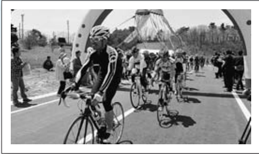
▲市道天童高原線の開通式