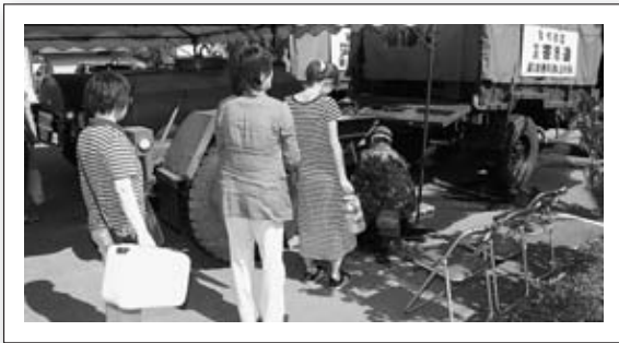
▲自衛隊のみなさんによる給水支援