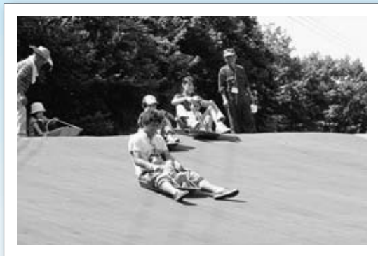
▲天童高原あそびの広場で夏そりを楽しむ