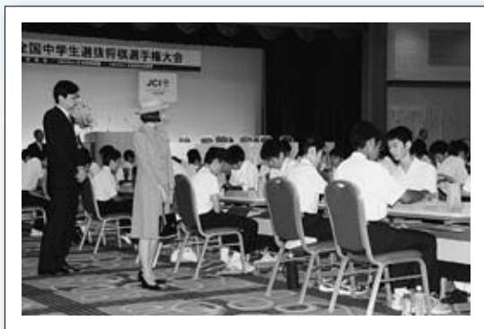
▲全国中学生選抜将棋選手権大会