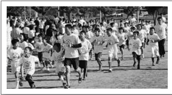
▲最後の開催となった天童もみじ健康マラソン