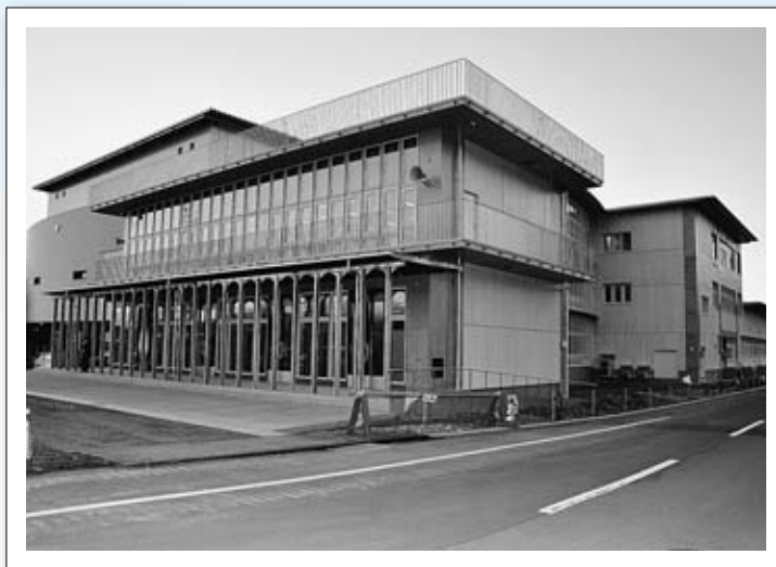
▲一中の新校舎では3学期から授業が始まる