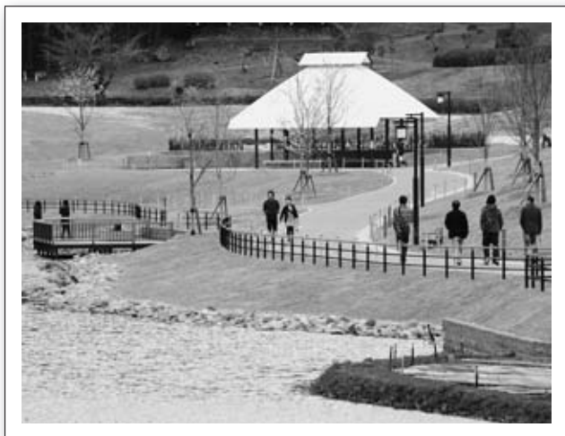
▲愛宕沼親水空間は散歩コースに最適