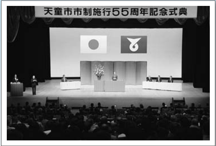
▲市制施行55周年記念式典

市制施行55周年を迎えたことは、さまざまな記念事業を開催するとともに、第六次天童市総合計画未来創造重点プロジェクト（後期計画）を策定し、行財政改革を推進しながら積極的なまちづくりに取り組んできました。