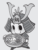
平成鍋合戦®キャラクター なべ丸くん