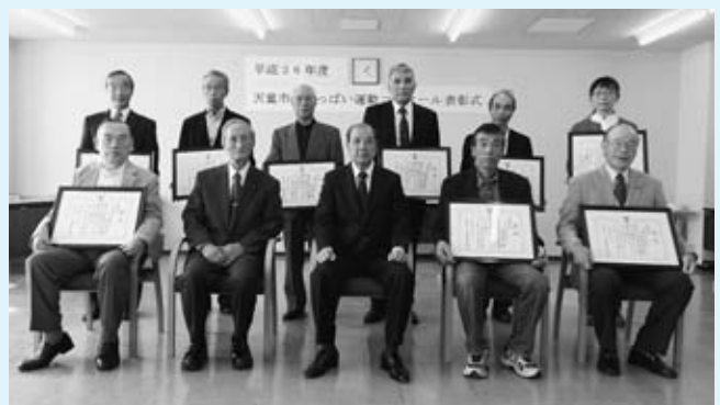
受賞された団体の代表のみなさん