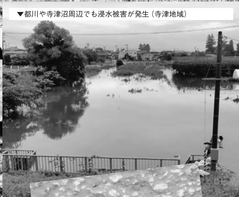
▼都川や寺津沼周辺でも浸水被害が発生 (寺津地域)