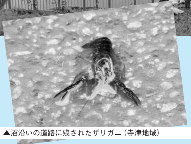
▲沼沿いの道路に残されたザリガニ (寺津地域)

7月28日から29日にかけて市内は大雨に襲われ、各地で被害が発生しました。28日の午後から市内全域で強い雨が降り、雨水が道路にあふれるなどしたため、市では避難所を開設するとともに、避難勧告を行うなどして安全確保を呼び掛けました。28日の夜には雨が弱まったものの、河川の水位が上昇し、山沿いの地域では土砂崩れの被害が、最上川に近い市内西部では住宅地や農地の冠水、道路の破損などの被害が発生しました。