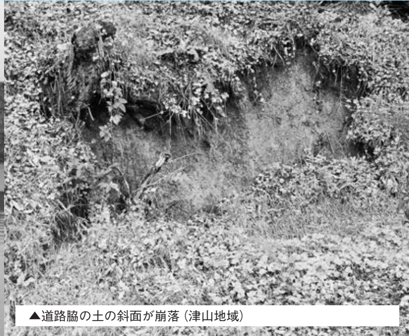
▲道路脇の土の斜面が崩落 (津山地域)