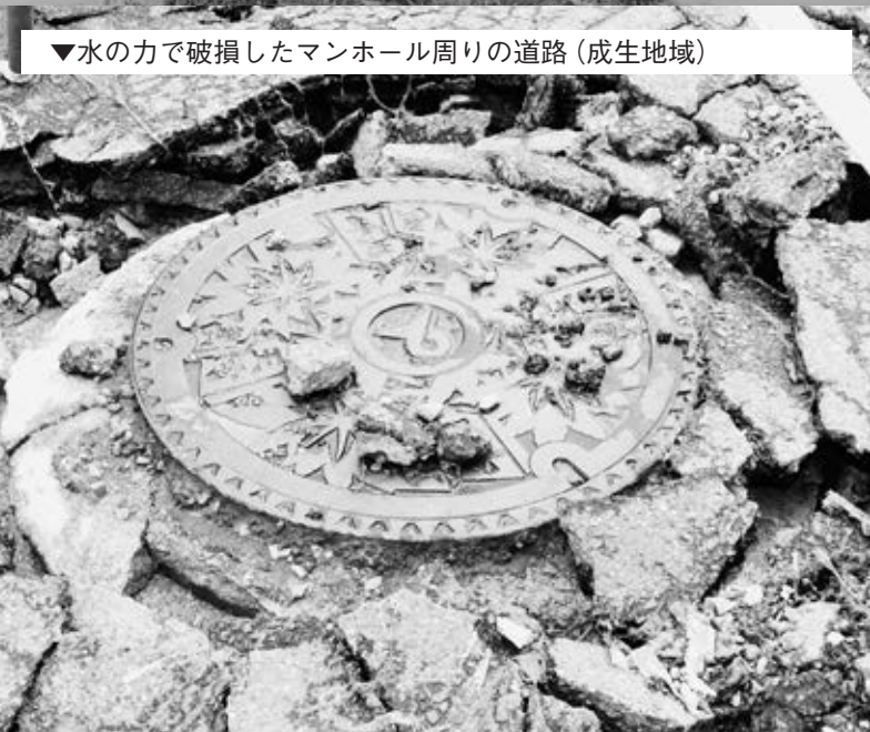
▼水のかで破損したマンホール周りの道路 (成生地域)