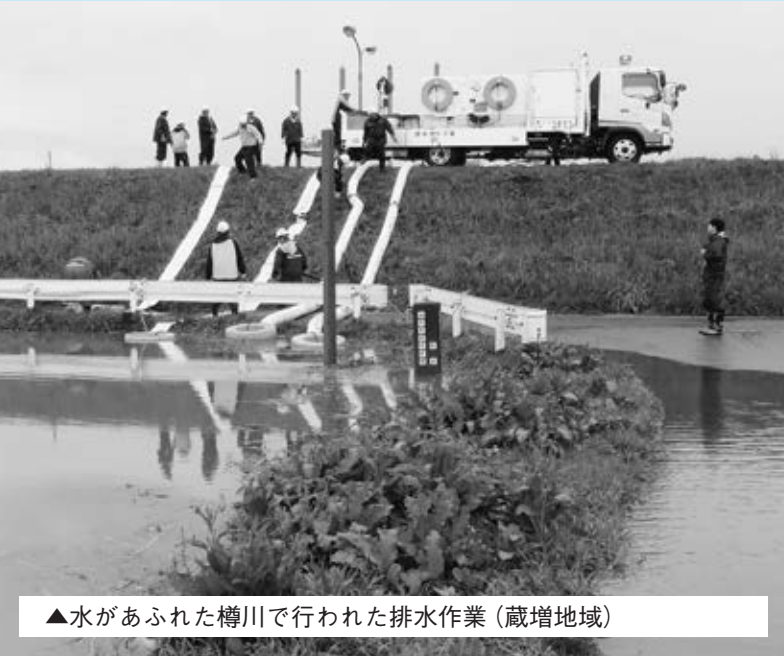
▲水があふれた樽川で行われた排水作業 (蔵増地域)