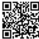
▲Welcome to TOHOKU隊登録サイト