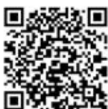
◀消費者庁 若者ナビ!