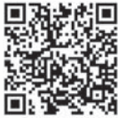
▲申し込みフォーム