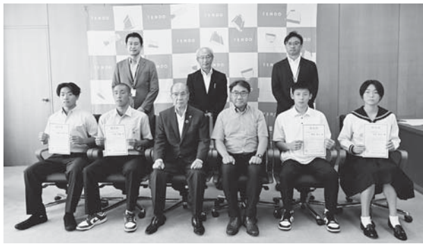
▲市トップアスリート育成強化支援事業の認定書を交付（8月）