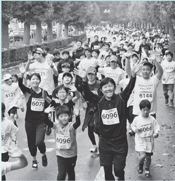
▲天童ラ・フランスマラソン2023を開催（11月）