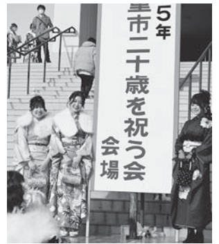
▲二十歳を祝う会を開催（1月）