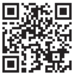
▲東北電力(株) ホームページ

▶受付時間 平日の午前9:00~午後5:00(年末年始[12月29日~1月3日]は除く)