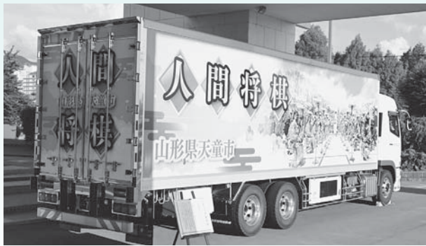
▲観光PRトラックが出発（7月）