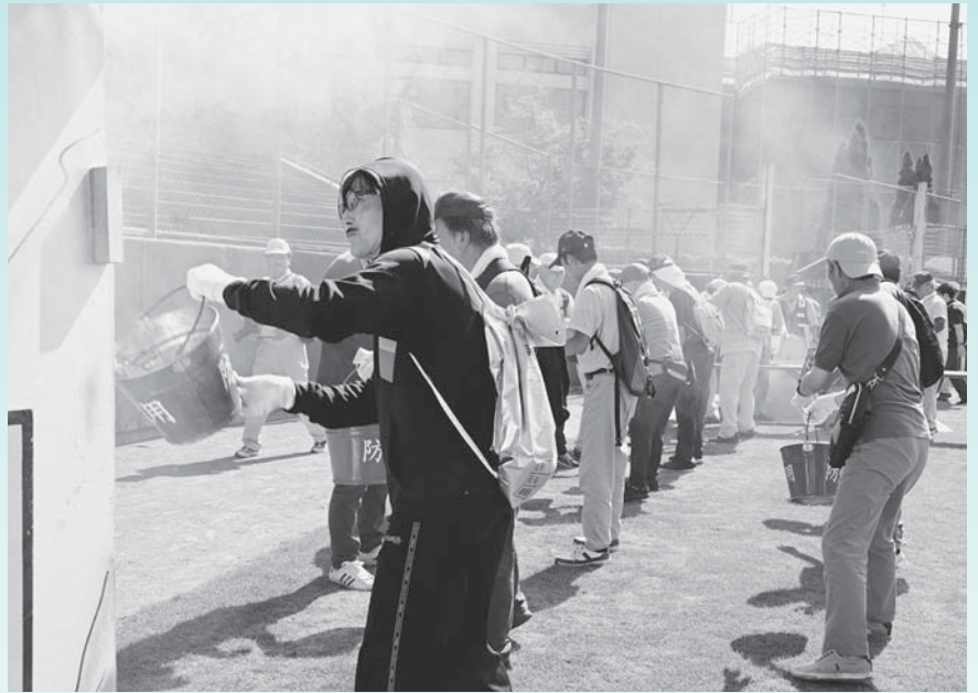
▲山形県・天童市合同総合防災訓練を実施（9月）