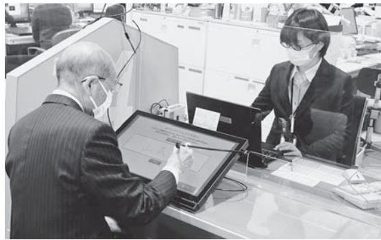
▲市民課窓口で「書かない窓口」を導入（2月）