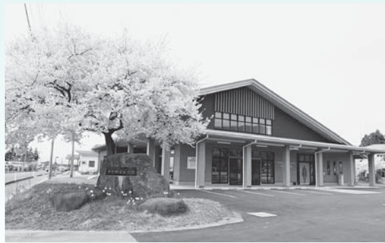
▲干布地域交流・活性化センター（市立干布公民館）が落成（3月）