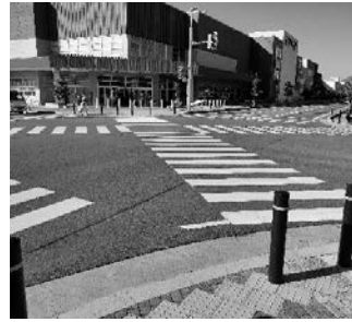
▲イオンモール天童南東角のスクランブル交差点