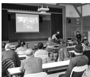
▲認知症サポーターフォローアップ講座の様子

いく。相談会については、「認知症カフェ」、「あったカフェ」、「Mカフェ」等をご利用いただきたい。家庭内の介護法は、いきいき講座等において調整していく。