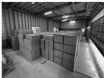
▲備蓄された非常用毛布や段ボールベッド

委員 防災備蓄品についてどのようになっているのか。 危機管理室長 現在の備蓄は非常用毛布13550枚、段ボールベッド1300台、簡易トイレ1万6000セットとなっている。また7月豪雨の検証を踏まえ、簡易食料1000食、飲料水1000本を備蓄し、継続して備蓄していく。