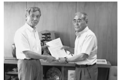
▲検討委員長から議長へ中間報告書を提出

議員定数については削減し、議員報酬については増額とする意見が委員の大勢を占める事実を踏まえ、検討委員会としては、この方向性をもって次回の一般選挙への反映が可能となるよう、具体的な議員定数削減の人数及び議員報酬の引き上げ水準について、引き続き検討を進めるものです。