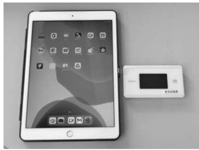
▲貸し出しする予定のモバイルWi-Fiルーター（画像右）

教育次長 小・中学生でインターネット環境の整っていない家庭へ貸し出すモバイルWi-Fiルーターを整備する。なお、小学生193台、中学生118台を購入し12月から貸し出しする予定である。