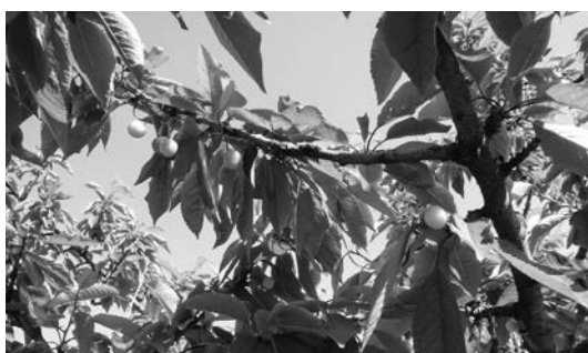
▲凍霜により被害を受けたさくらんぼ

農林課長 令和3年4月に発生した凍霜により、農作物に甚大な被害が発生した。品目ごとの被害額は次のとおりである。補助額は対象面積に交付単価と補助率を乗じて算出される。補