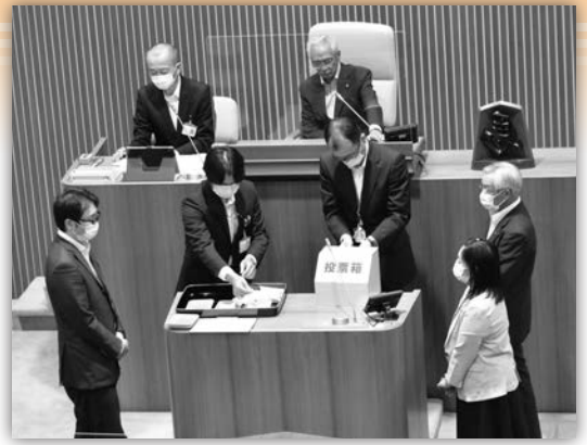
▲各会派の立ち会いによる開票作業

9月21日の本会議において、正副議長の辞任に伴う正副議長選挙が行われ、投票によって新しい議長、副議長が選ばれました。