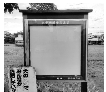
▲設置済みの掲示板

子どもたちの取組みを通し、公園を使う大人にも環境美化の啓発効果が期待できる。学校や地域と連携し小学校区に1カ所を検討する。