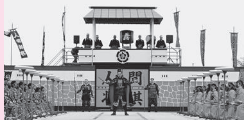
▲人間将棋に信長公出陣

A 信長公ゆかりの10市町の交流を目的に2年に1回開催されている。令和7年は本市で開催される予定であり、人間将棋の期間に合わせて実施する。