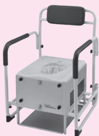
▲トイレの衛生向上に

A 災害時に開設される災害ボランティアセンター用のポータブル自動ラップ式トイレ2台を導入する予定。これは、トイレにセットした袋に用を足すと、袋を自動で圧着するもので、災害時の衛生環境の向上を図ることができる。