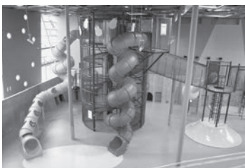
▲来館者200万人を超える人気施設