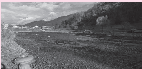
▲水が抜かれ工事が進む愛宕沼

所管課からは、「沼の水質を改善する装置であるミキサの更新と再設置に併せて、沼一面に繁茂したハスの撤去を行っている」、「度重なる大雨によって工期に遅れが生じているが、令和7年1月には作業を完了する予定で、沼の水の循環が良くなり、近い将来、よりきれいな親水空間となる」との説明を受けました。