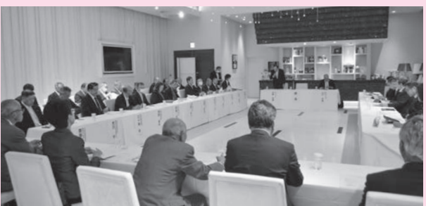
▲農作物の高温障害への対策も話題となりました

特に、農業の担い手不足の解消に向けて、新規就農者への支援の拡充を求める意見などが多く出されました。