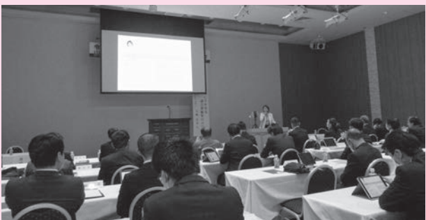
▲読まれるためのコツを伝授

講演では、読者を記事に引き込むためには、写真と見出しを工夫して視覚へ訴えかけることの大切さや、各市の議会報の良い点や改善点についてアドバイスがありました。市民に寄り添う議会報になるように、この研修で学んできたことを、今後の紙面づくりに活かしてまいります。