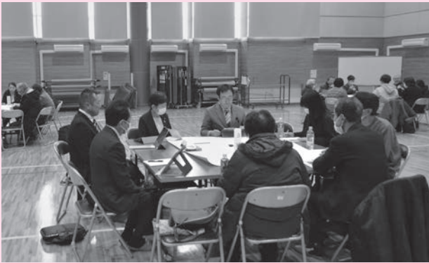
▲まちの課題について活発に話し合われました

1月19日、市総合福祉センターで、議会報告・意見交換会が行われました。寒中の時期ではありましたが、19人の方から参加いただき、「地域活性化について」、「福祉・子育て支援について」、「スポーツ全般について」の三つのテーマで意見交換を行いました。各班の議員がファシリテーター（進行役）や発言者となって、参加者の質問や意見に真摯に答えていました。 今回の議会報告・意見交換会の詳細は、次号で報告します。