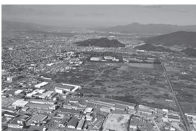
▲新工業団地をものづくりの拠点に

A 権利者であっても土地の所在が分からないなど、相続が適切に行われていないことが考えられる。