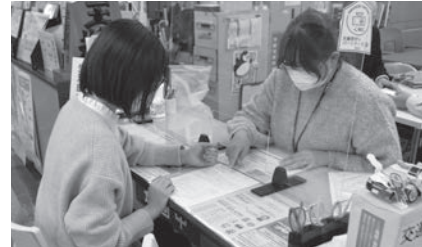
▲社会に合わせた処遇改善に期待

会計年度任用職員の処遇については制度導入後、年々改善されていると捉えている。今後も国の制度に沿った運用を基本とし、効率的、効果的な行政運営に努めたい。