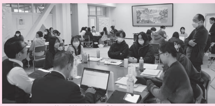
▲若い感性を持ったご意見をいただきました

はじめに学生から将来就きたい仕事などの自己紹介の後に、「どのようなまちに住みたいか」、「政治や議会についてどう考えているか。こういうまちづくりをしてほしい」ということはあるか、「議員に聞いてみたいこと」の三つの質問についてグループ内で話し合いをしてもらいました。 参加者は市内外の異なる地域の出身でしたが、天童市で生活する中で感じたことや、将来まちがこうなつてほしいということなどについて、自分の将来像と重ねながら活発に意見が交わされました。