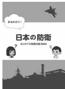
▲はじめての防衛白書

学校では教員間の回覧にとどめ、授業等では使用していない。市教育委員会としては、教材の活用に際して、教育基本法に基づく政治的中立性を確保し、児童の心情に否定的な影響を及ぼさないようにするなど、学校に指導する。