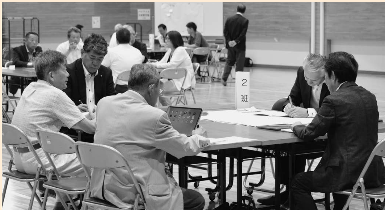
▲暮らしやすいまちづくりを目指し、意見を交換