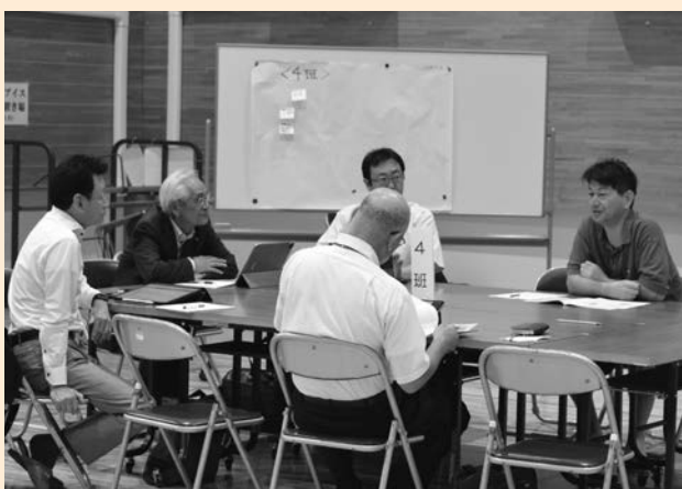
▲美しい景観のまちづくりに向けて