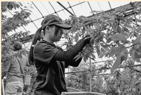
▲高温対策が安定生産のカギに

A 近年、農作物の高温障害の被害が多発しているため、気候変動に強いサクランボの産地づくりに取り組む事業者に対して支援を行うもの。事業の内訳は、散水設備の導入、冷房設備の導入、井戸の掘削などである。