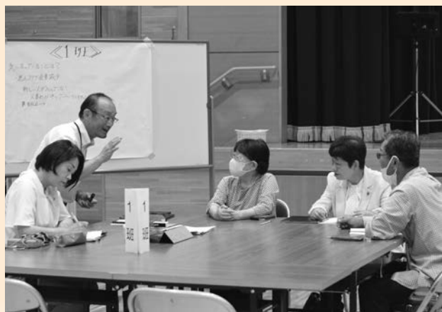
▲高齢者福祉を中心に意見交換

・老人クラブの会員が減少し、組織の維持に苦慮している。努力はしているが入ってもらえない。 ・人と人とのつながりが希薄化し、町内会組織が弱体化している。災害時などの対応に不安が大きい。 ・イベントなどの行事で地域の連帯と活力を高めることが重要。行政が指導するのではなく地域住民の意思で動くことが大切。 ・敬老会の祝い品の配達を子ども育成会などが協力して実施している。