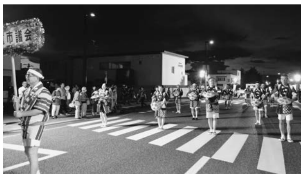
▲花笠おどりパレードに参加

天童夏まつりに参加された市民の皆さんが、これからもいきいきとまつりを楽しむことができるよう、まちづくりに取り組んでまいります。