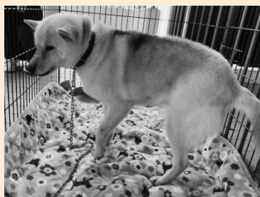
▲予防接種は飼い主の責務です

A 犬の登録数2346頭に対し、接種実施頭数が2102頭で、244頭が未接種と見られる。4月から6月末までに接種していない犬の飼い主に対して、9月に督促の通知を送って接種を呼び掛ける対応を行っている。