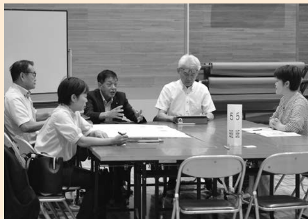
▲病気や障がいのある方も暮らしやすく