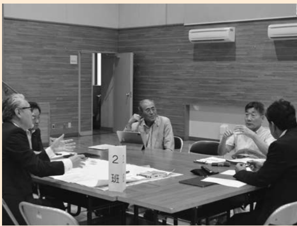
▲高齢者の移動手段はどうあるべきか