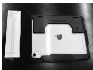
▲導入されるタブレット端末

A これまで各市町村がそれぞれ異なる機種の端末を導入してきた経緯があり、各市町村が最適な機種や仕様を選択しているとは判断しているため、全ての市町村で共通の仕様にするという意見はなかった。