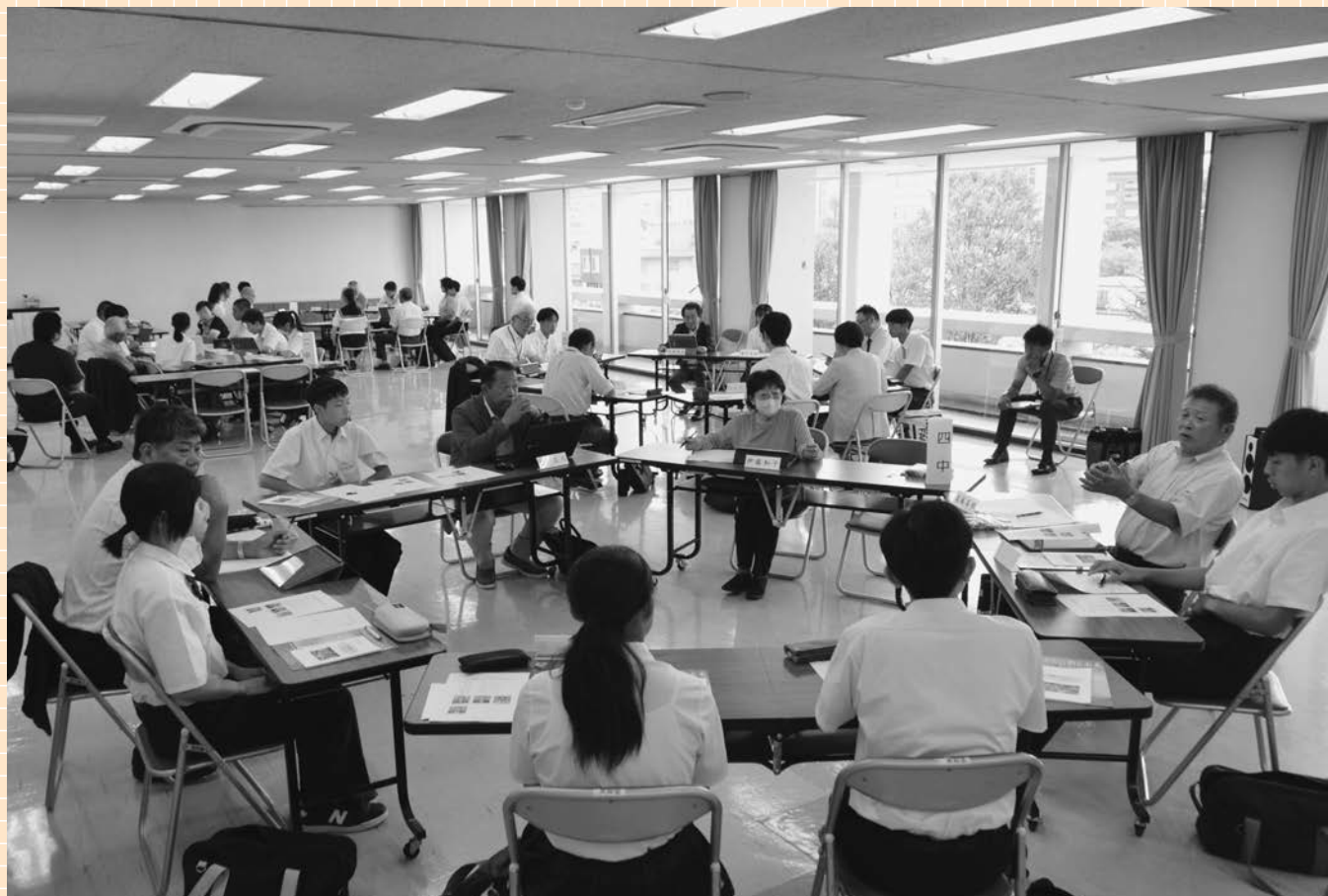
▲みずみずしい感性から新鮮なアイデアが生まれました