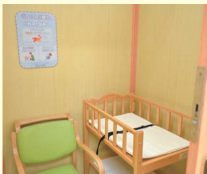
▲市立天童南部公民館に設置された赤ちゃん休憩室