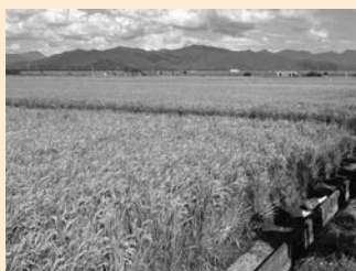
▲水が欠かせない水稻の生産

今回の被害に対し、9月定例会の補正予算では、高温・少雨に伴う渇水対策に関する内容が可決されています。