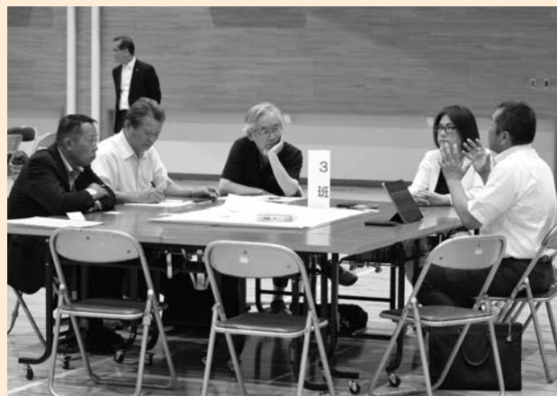
▲議員の人材確保がテーマに