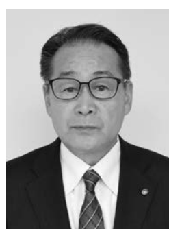
副議長 古澤 義弘