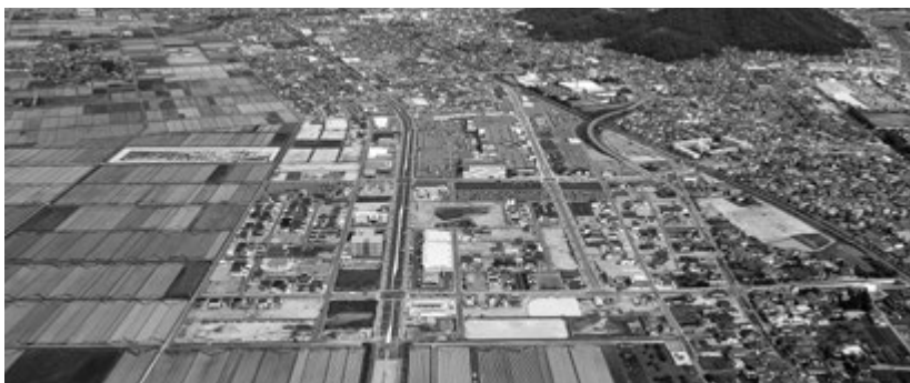
▲空から見た芳賀土地区画整理地内

市民課長 29年11月に芳賀地区の住居表示を行うものである。内訳は台帳図作成や基本図などの図面作成費790万円、住所変更の通知書や新旧対象一覧表の作成費160万円、街区ごとの表示板製作費360万円及び諸経費となっている。