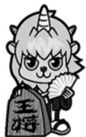
▲モンテディオ山形とコラボしたご当地ディーオ(将棋の駒を持った棋士)

スポーツ施設整備基金として1億円を計上した。 プロスポーツチームの存在は、スポーツの振興、交流人口の