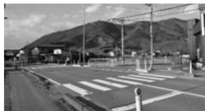
▲上貫津の県道との交差点

貫津沼東側を通る市道温泉原町線は貫津、奈良沢下から通う天童一中生の通学路になっている。地元では通学路の安全を願い、二回請願を行っていた。それから40年も経過しているのに、何の対応もない。 生徒達 通学路の歩道と一体的に整備される道路と、通行上便利になるだけの道路・歩道の整備を比較し、どちらがより重要と考えるか。