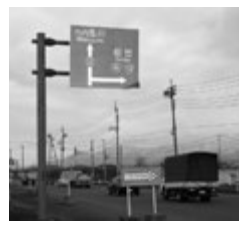
▲古井戸地区T字路付近

これまで都市計画マスタープランに明示された古井戸地区は、国道48号線上にあり、さらに山形空港線と隣接し、東北中央自動車道インターに最も近い地域であり最適地と考える。これからの社会情勢や企業ニーズの変化を考慮して、古井戸地区の工業・業務系団地の用地も確保すべきと考えるが、市長の考えは。