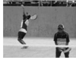
▲スポーツをしている子どもたち

市内の子どもたちは一流選手を目指してスポーツに励んで楽しんでいる。若い希望に満ち溢れた人材が天童市を背負って大会に出場するので、子どもたちのスポーツ活動を支援するためにも成果や実績を考慮したさらなる補助を検討してみたい。