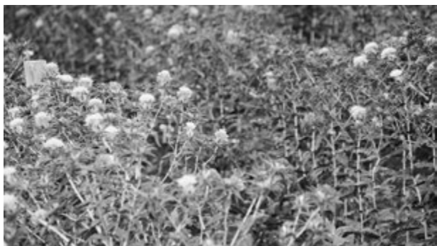
▲7月上旬に見頃をむかえる紅花

委員 30周年を迎える天童紅花まつり記念事業の内容は。 商工観光課長 例年のイベントに加え、紅花の食をテーマに、山辺高校、山形学院食料科といった調理科の高校生や食改会員などに参加してもらい、料理レシピコンテストを開催したい。