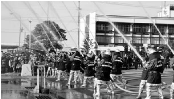
▲消防団による放水の様子

消防課長 消防団員が火災・自然災害などで出動した際に1人1回1000円を支給するものである。現場に到着する前に引き返した場合や誤報の場合には支給しない方針である。なお、詳細については、支給要綱を策定し、周知を図りたい。