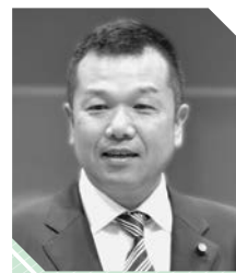
鈴木 照一 議員