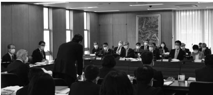
▲議員ほか、全ての出席者がマスク着用で行われた予算特別委員会

港へ3年、海外拡販に向けてプロモーションをかけてきた。今年度の香港は、デモの影響もあり、現地販売員に委託してPRした。来年度は台湾、香港とも現地販売員でPRしていく。 商工観光課長 仙台タイの定期便が就航して、本市への誘客チャンス、果物の拡販チャンスと捉え、現地での試食会や現地著名人によるPRをしてもらうものである。