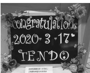
▲市民課窓口を設置しているフォトボード

休日や時間外においては、守衛室で警備員が受け付けている。その際の記念写真撮影は、人的対応やフォトボードの設置場所など、関係課で協議し、実施可能かどうか検討していく。