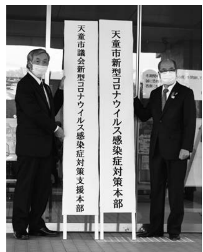
▲感染拡大防止に向け、力を合わせる

天童市議会では、令和2年4月20日、議長を支援本部長、全議員を構成員とする支援本部を設置しました。