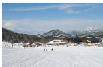
天童高原スキー場