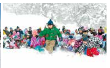
スノーパークフェスタ