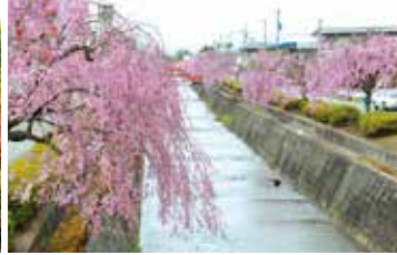
倉津川のシダレザクラ