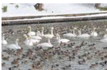
寺津沼のハクチョウ