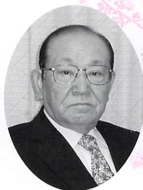
天童文化団体協議会