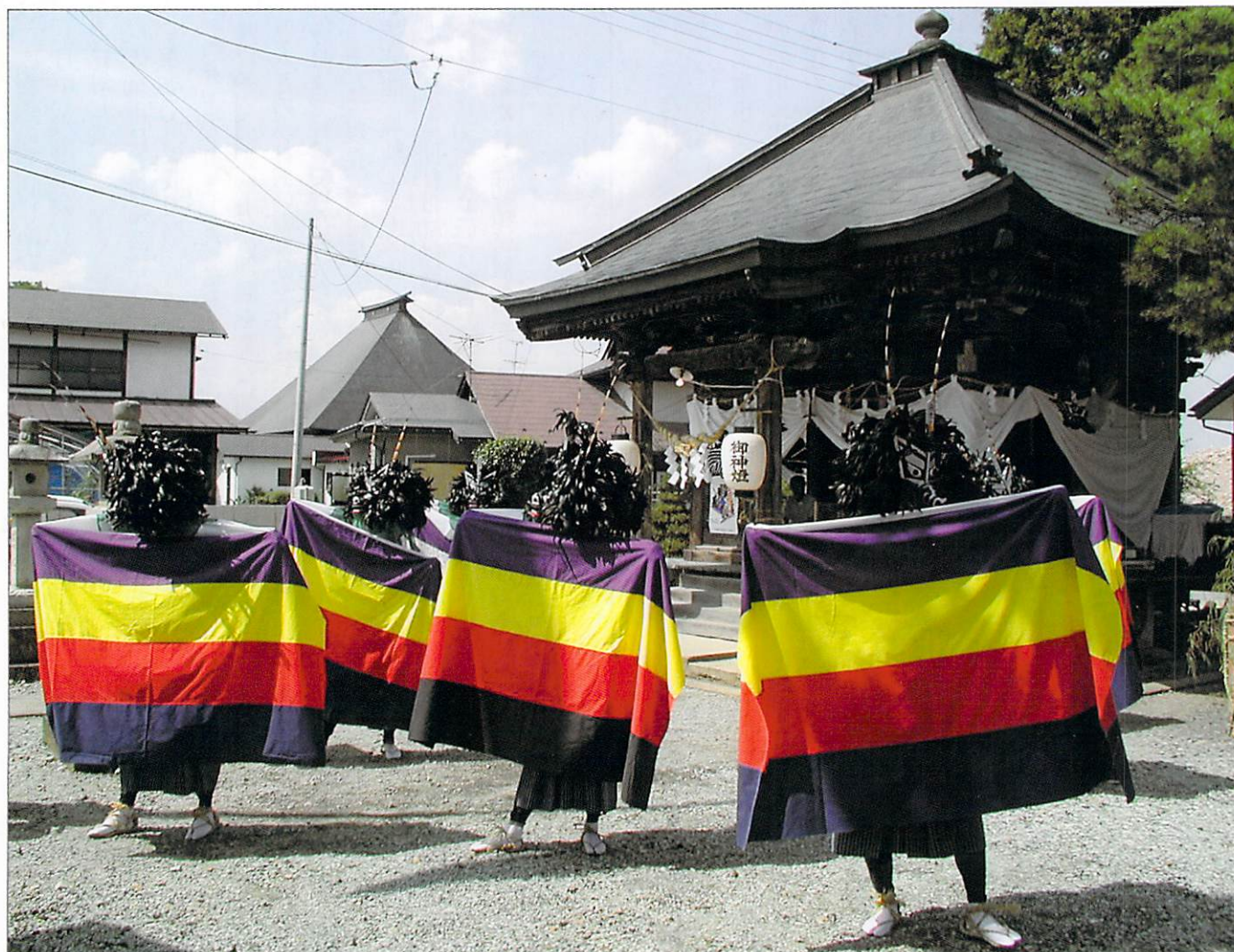
写真提供 高揃獅子踊り会