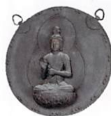
金銅聖観音像懸仏