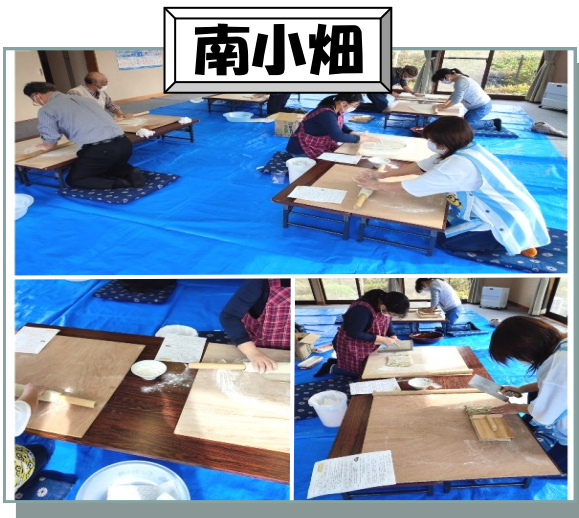
自分で打った蕎麦は格別だね〜。 家族も舌鼓をうちました。