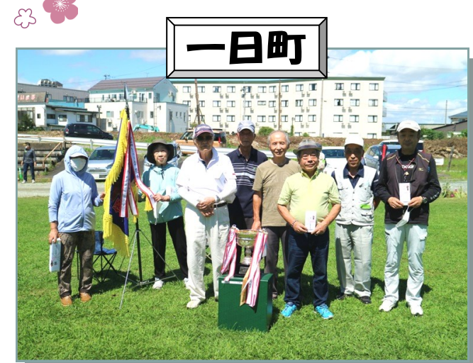
天童南部レクリエーション大会、一日町チーム総合優勝(^)v