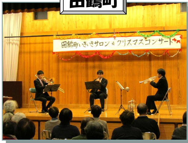
山形交響楽団の首席トロンボーン奏者が田鶴町にお住まいなんです。