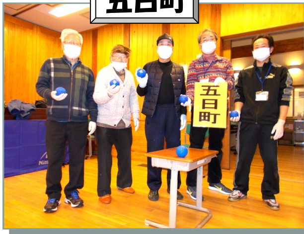
五日町チーム。優勝目指すぞ！あ〜てが。