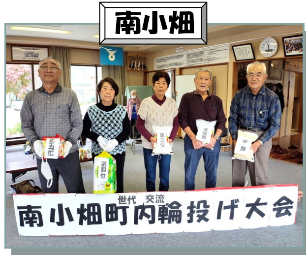
今年も世代交流事業で輪投げ大会開催しました。シニアパワーが炸裂！！