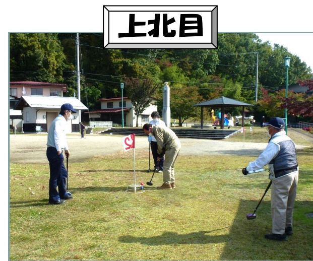
世代交流GG大会参加者