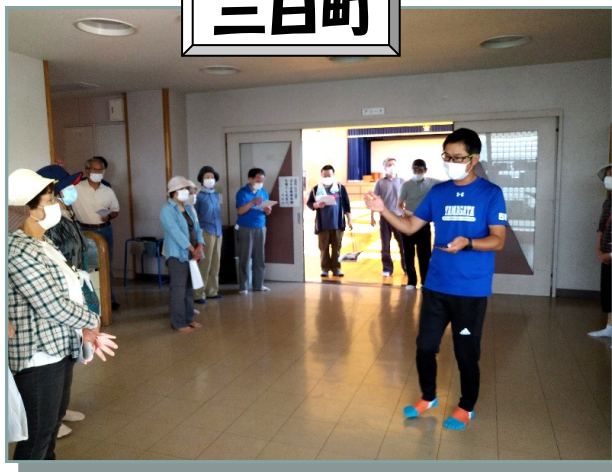
三日町自主防災会にて、避難所である南部小学校まで歩いて移動、見学。