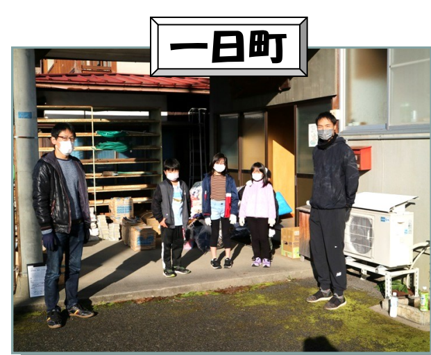
一日町公民館子ども会育成会。資源回収。