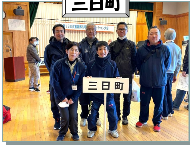
快進撃！三日町チーム、冬季レク大会総合5位入賞！