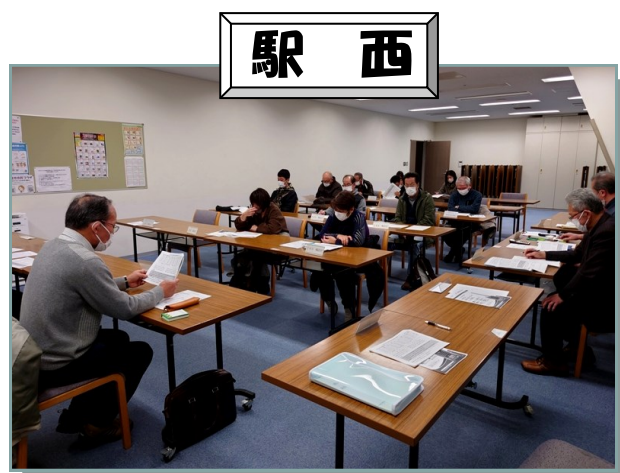
第8回駅西町内会理事会のようす！