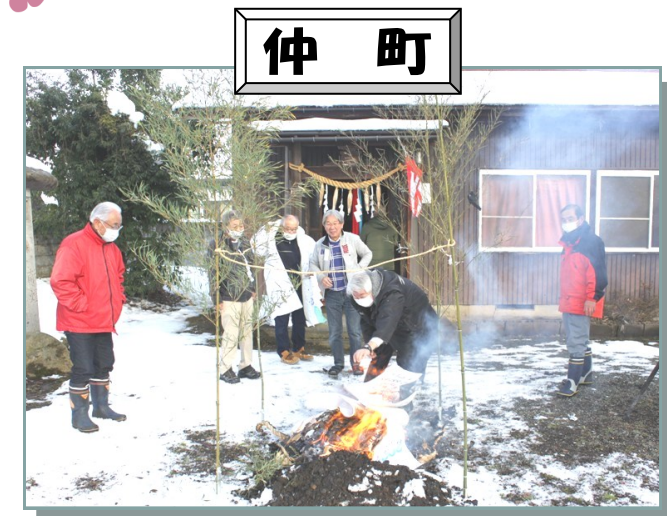
古札焼納祭を行いました。