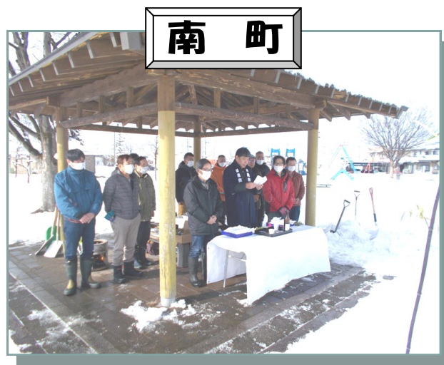
今年も無事に、お斎灯ができました。これからも安全・安心に暮らせますように