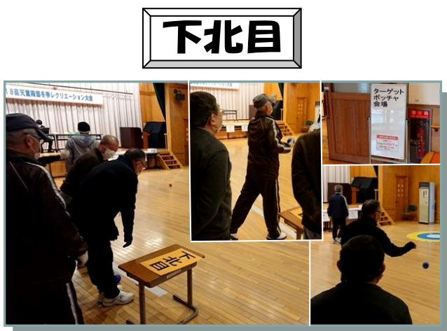
18回南部冬季レクに参加。代表で参加してくださった役員の方々は大変お疲れ様でした