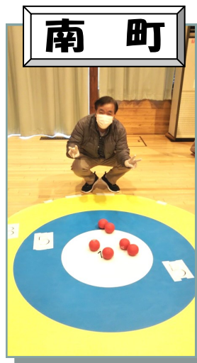
ポッチャ大会で初の満点。おだぐやるんね〜がい。あんたは偉い