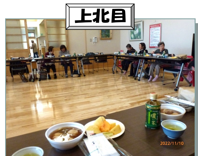
いきいきサロンと芋煮会