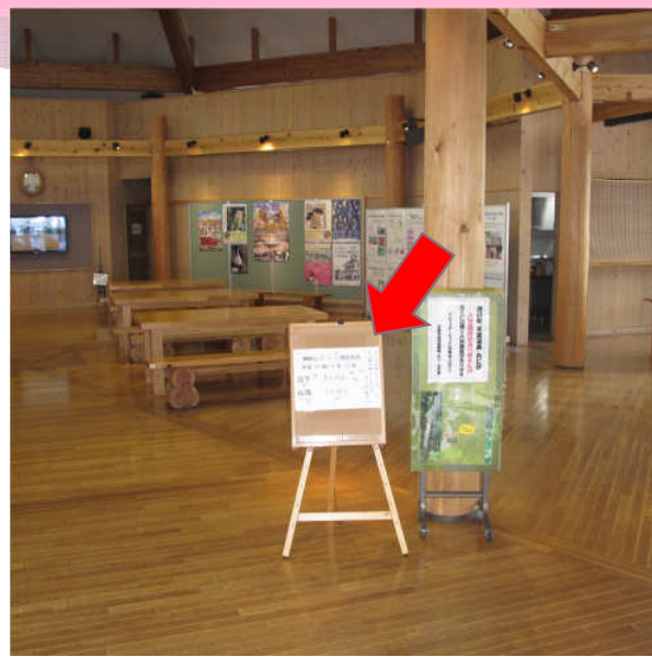
森林情報館もり一な内